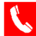
Teléfono para la lucha contra incendios