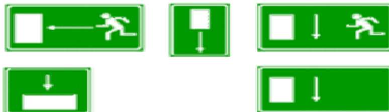
Via de salida de socorro.