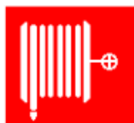
Manguera para incendios