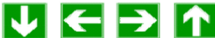
El reción que debe seguirse (señal indicativa adicional a las siguientes)