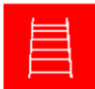
Escalera de mano